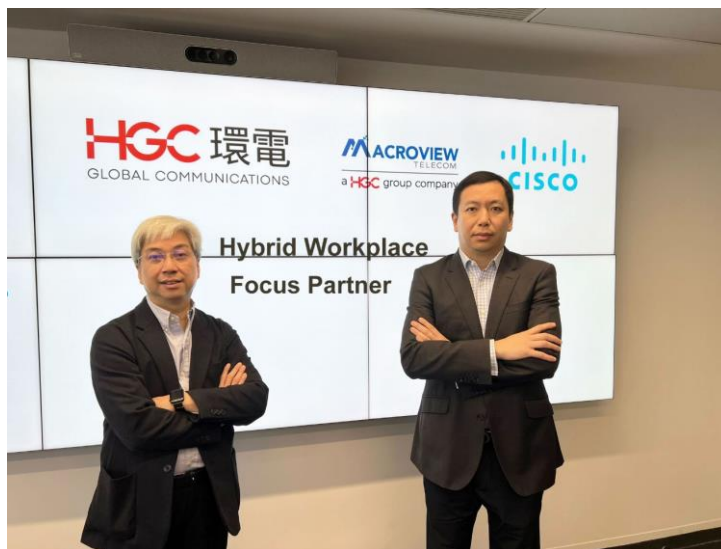
HGC 環電集團旗下高威電信是思科混合辦公方案的重點合作夥伴。